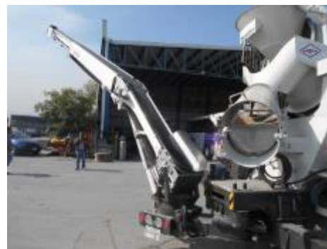
Su telescópico n°1 de 4m sale.