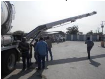
BANDOLLA extendida. 100 %.