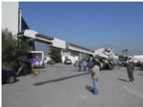
Telescópico n°2 de 1 m sale.