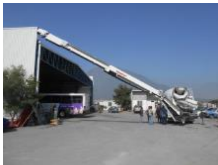
La BANDOLLA en posición de colar.