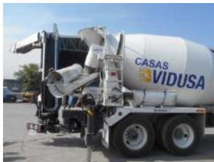
La BANDOLLA rota a 90°.