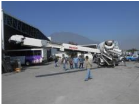
La BANDOLLA esta casi recta.