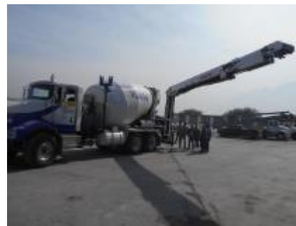
La BANDOLLA se levanta.