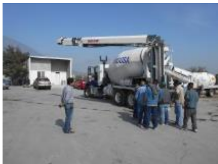
La BANDOLLA gira para salir.

Nueva Generación 2014 Más fuerte y más veloz