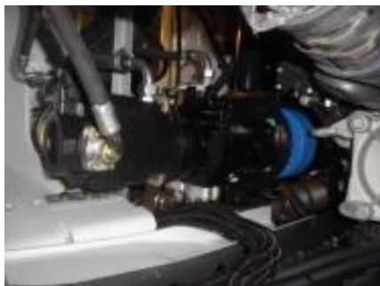
Bombas de pistones y sistema hidráulico proporcional = más preciso y más rápido