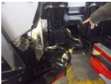
2 pivotes de engranes tipo grua (seguridad 100%) y estabilizadores reforzados derechos

LA BANDOLLA NUEVA GENERACION es totalmente nueva por sus cambios de tecnología; más larga de 1metro, sistema hidráulico proporcional, pivotes de engranes y muchas otras mejoras permiten un uso más intensivo y rudo, por otra parte, gana de 25% a 30% de tiempo en los colados.