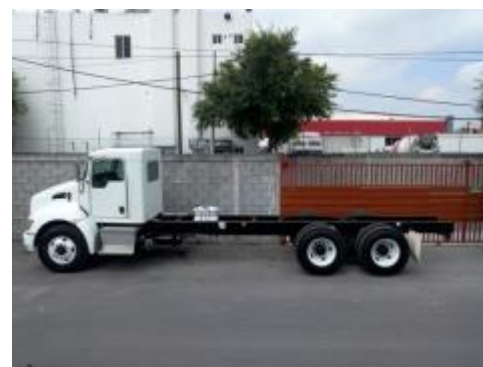
T370 de lado.