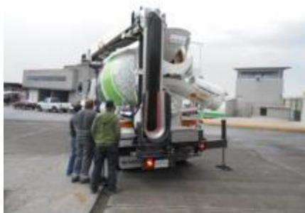
La BANDOLLA todavía esta plegada.

www.BANDOLLA.com Nueva Generación 2014 Más fuerte y más veloz