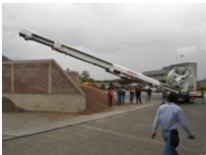
La BANDOLLA gira para colar. La BANDOLLA en posición de colar a 45° Cliente, proveedor y importador.