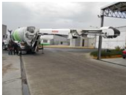
La BANDOLLA en posición de colar.