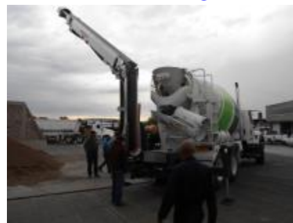
La BANDOLLA se levanta.