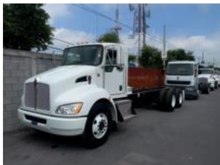
T370 de frente.