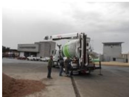
La BANDOLLA empieza a salir.